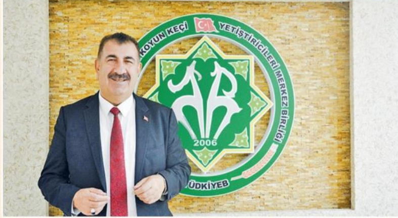
Türkiye Koyun Keçi Yetiştiricileri Merkez Birliği (TÜDKİYEB) Genel Başkanı Nihat Çelik

Öte yandan üretim kadar özellikle küçükbaş et ve süt ürünlerinin tüketiminin yaygınlaştırılması gereğinin altını çizen Çelik, insanlarımızın doğal ortamlarda yetiştirilen kuzu ve keçilerimizin et ve süt ürünleriyle beslenmesinin gelecek