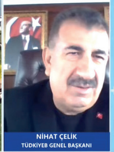
NIHAT ÇELİK TÜDKİYEB GENEL BAŞKANI