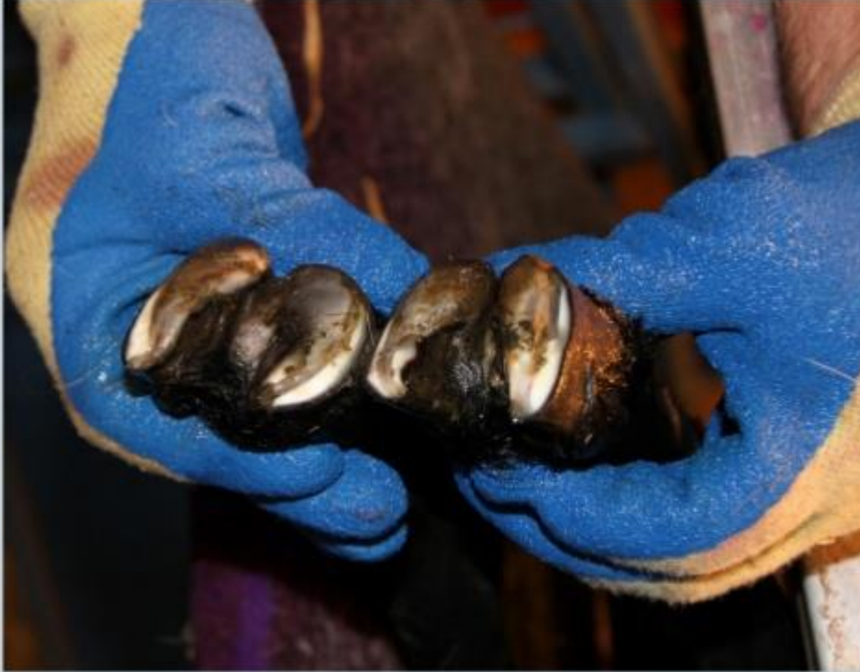
İşte bakımı yapılmış tırnaklar.