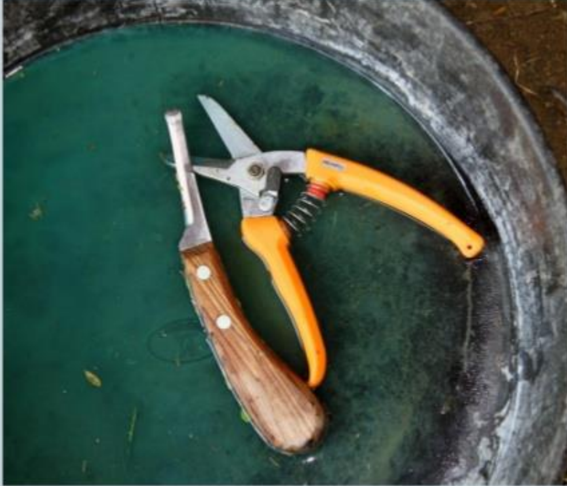
Tırnak kesimlerinde kullanılan tırnak bıçağı ve makası