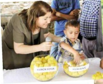
Dağıtımla ilgili kuralara, maden kazasında yakınlarını kaybeden aileler de katıldı, 12 aileye hayvanlar teslim edildi.