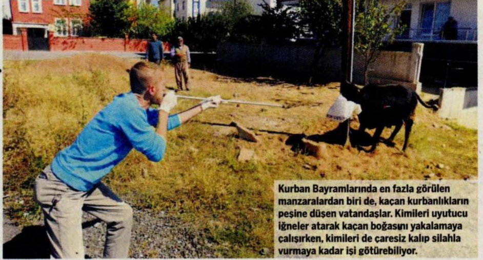
Kurban Bayramlarında en fazla görülen manzaralardan biri de, kaçan kurbanlıkların peşine düşen vatandaşlar. Kimileri uyutucu iğneler atarak kaçan boğasını yakalamaya çalışırken, kimileri de çaresiz kalıp silahla vurmaya kadar işi götürebiliyor.

Çünkü erkek hayvanlarda gebelik riski yok. Dişi hayvanlarda özellikle koç katımlarının başladığı bu dönemlerde gebelik olabiliyor ve bu dönemde kurbanlık olarak satılabiliyor. Üretici bunu bilmeden satıyor. Bilse zaten elindeki damızlık hayvanını satmaz. Bazen kaçak koçlanma oluyor. Üreticiler farkında