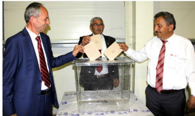
Seçimde üç aday oy kullanırken