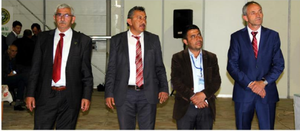
Damızlık Koyun, Keçi Yetiştiricileri Birliği'nin 3. Olağan Genel Kurulu Cumartesi günü gerçekleştirildi