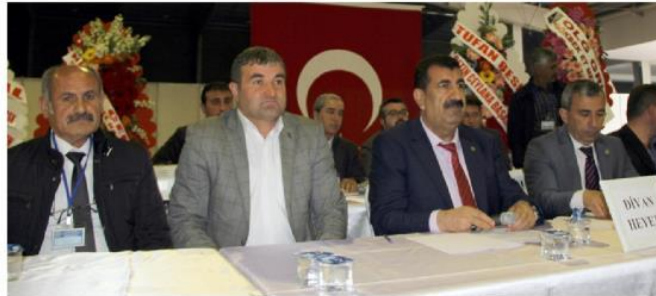
Toplantının divan üyeleri