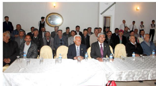
Genel Kurul Taç Döğün Salonunda yapıldı.