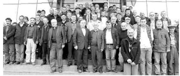
Samsun ili Damızlık Koyun ve Keçi Yetiştiricileri Birliği üyeleri mali kurul sonrası hatıra fotoğrafı da çektiler.

Ayrıca Bakanlık'ca hazırlanan ana sözleşme hükümleri de Birlik üyelerince oy birliğiyle kabul edilirken, olgun bir hava içerisinde geçen genel kurulda üyeler daha aktif ve verimli çalışmaya ilgili görüşlerini de ortaya koydu. Başkan Balı, "Önümüzdeki yıllarda daha aktif ve verimli bir şekilde üyelerimize fayda sağlayacak çalışmaların yapılması genel kurulca be-nimsenmiştir. Küçükbaş hayvan yetiştiricilerine vermiş olduğu desteklerinden dolayı Canik Belediye Başkanı Sayın Osman Genç ve ekibine tüm üyelerimiz şahsım ve yönetim kurulu adına teşekkür ederim" diye konuştu.