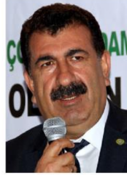
TÜDKİYEB Genel Başkanı Nihat Çelik