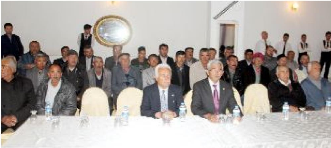
Çorum Damızlık Koyun ve Keçi Yetiştiricileri Birliği Mali Genel Kurulu önceki gün gerçekleştirildi.

Genel kurulda daha sonra gündem maddeleri görüşülerek karara bağlandı. (İHA)