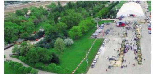
Türkiye'de ilk kez düzenlenen Çoban Fuarı'na Atatürk Kültür Merkezi