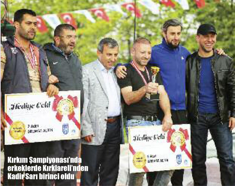
Kırkım Şampiyonası'nda erkeklerde Kırklareli'nden Kadın Sarı birinci oldu

da geçen yılın şampiyonu, Karamanlı Gülşah Ün birinci oldu. Erkekler kategorisinde birinci olan kırkımçıya 5, ikinciye 2, üçüncüye de 1 gremse altın, kadınlar kategorisinde de birinci olan kırkımçıya, kırkım makinesi verildi.