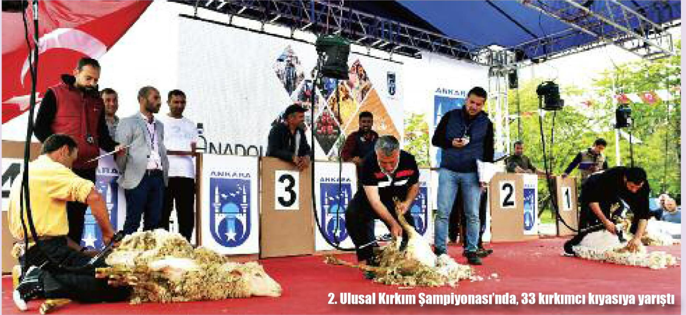
2. Ulusal Kırkım Şampiyonası'nda, 33 kırkımcı kıyasıya yarıştı