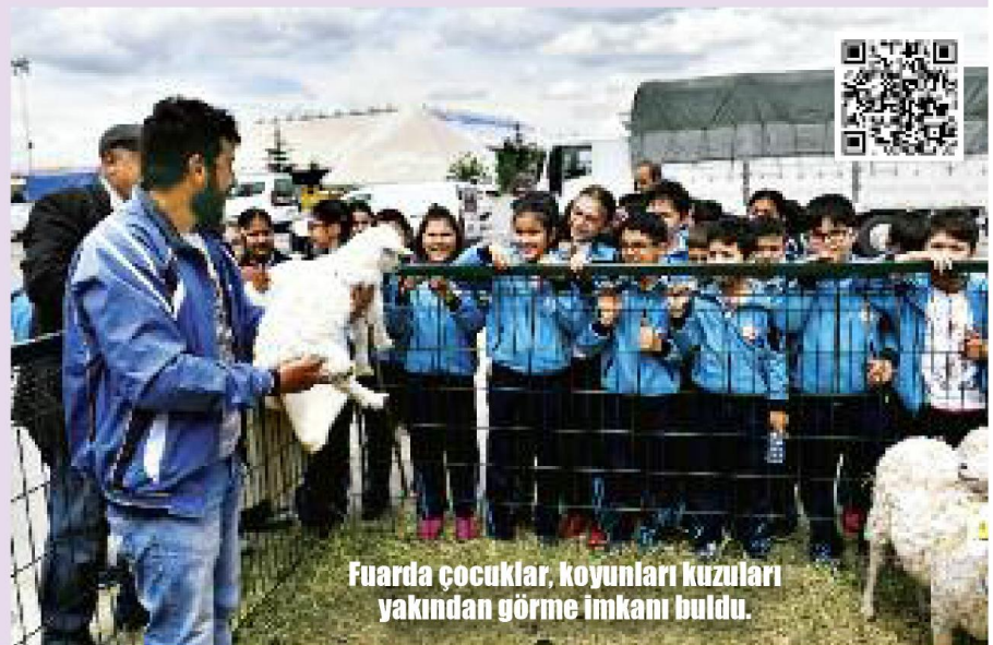
Fuarda çocuklar, koyunları kuzularını yakından görme imkanı buldu.

-3166 çiftliğe 883 ton yem bitkisi dağıttık. 931 çiftçimize 67 bin 570 tane meyve fidanı dağıttık. 286 çiftçiye 89 ton