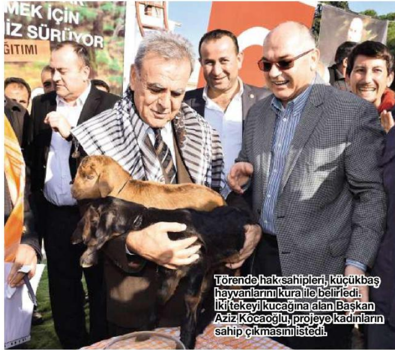
Törende hak sahipleri, küçükbaş hayvanlarını kura ile belirledi. İki tekeyi kucagina alan Başkan Aziz Kocaoğlu, projeye kadınların sahip çıkmasını istedi.

"Bölgeye elimizden gelen desteği vermeye çalışıyoruz. Üniversiteden 15 kişilik bir heyetle Bakırçay ve Gediz Kalkınma Stratejik Planı'nı hazırladık. Çalışmalarımızı aklın ve bilimin ışığında sürdürüyoruz. Ziraat Odası Başkanlarımız ile koordineli bir şekilde tarım makinesi