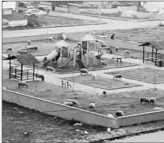
Kavanium Körfez Sitesi'nin hemen karşısına yapılan çocuk parkı adeta koyun parkına dönmüş. Vatandaş bu görüntüden şikayetçi.

Körfez Belediyesi tarafından Kavanium Körfez Sitesi'nin hemen karşısına yapılan çocuk parkı ilginç görüntülere sahne oluyor. Son günlerde Kavanium Körfez ve çevre apartman sakinleri tarafından parkta otlayan koyunlar tepki çekmeye başladı. "Parkta çocukların oynaması gerekirken neden koyunlar otluyor" diye merak eden mahalle sakinleri tepkilerini şöyle dile getiriyor: "Sözde Körfez artık Kocaeli'nin yeni yapılan ve gelişimi hızlı ilerleyen ilçelerinden birisi. Ama öyle görüntüler var ki hayvan çiftliklerinde yetiştirilmesi gereken büyük ve küçükbaş hayvanlar sitelerin önüne kadar gelmiş, hatta parka kadar girmiş durumda. Tekrar geçmişe dönmenin âlemi yok. Çocukların parkında bu koyunların işi ne? Maden bu kadar güzel bir park yaptınız neden denetlemiyorsunuz. Sadece bununla değil daha önce de bu parkta bulunan banklar kimliği belirsiz kişiler tarafından yakılmıştı. Bu nedenle belediyenin denetimlerini artırmasını ve koyun parkına dönen bu parkın çocuk parkına dönüştürülmesini istiyoruz" ■ Esra KORKUSUZ