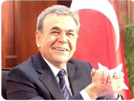
Aziz Kocaoğlu İzmir Büyükşehir Belediye Başkanı

İzmir Büyükşehir Belediyesi, tarım ve hayvancılığın yol haritası için 12 ayrı başlıkta yeni bir çalışma başlattı. Başkan Aziz Kocaoğlu, akademisyen ve sektör temsilcilerinin de yer aldığı bu çalışmayla sadece İzmir ve çevresi için değil, ülke tarımının kalkınması için de yeni bir model oluşturacaklarını söyledi.