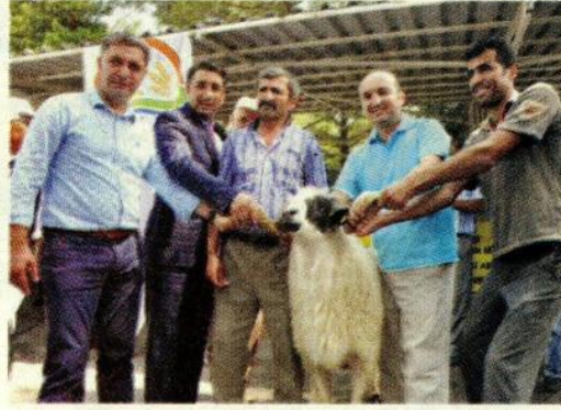
Amasya'da koyun ve keçi yetiştiricilerine kura ile 32 adet damızlık koç dağıtımı yapıldı.