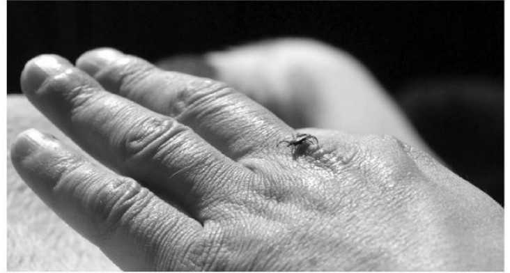
Kene ile mücadele çalışmalarında ilaçlama ve farkındalık çalışmaları devam ediyor.

2007 yılında başlayan mücadele devam çalışmalarıyla birlikte bu tür eğitimler etmekte olup, 2015 yılında da ilaçlama ve farkındalık oluşturacak çalışmalar