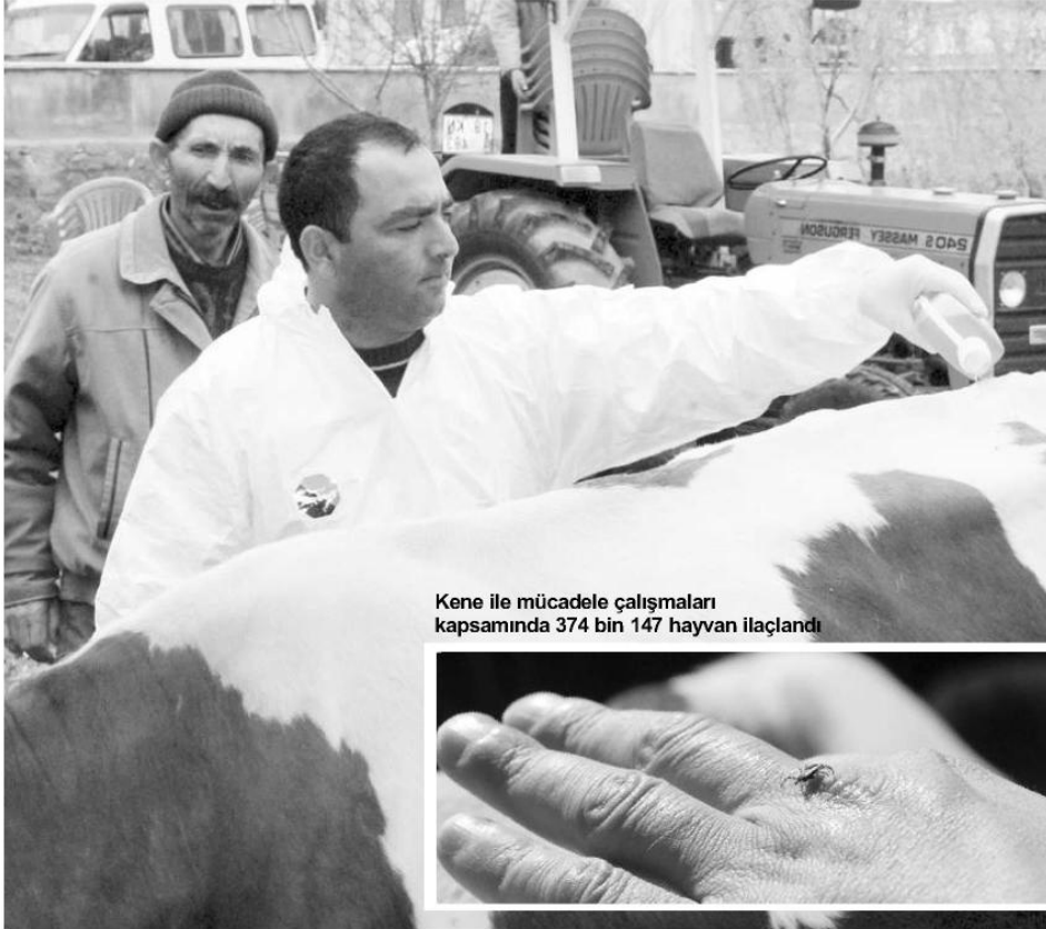
Kene ile mücadele çalışmaları kapsamında 374 bin 147 hayvan ilaçlandı