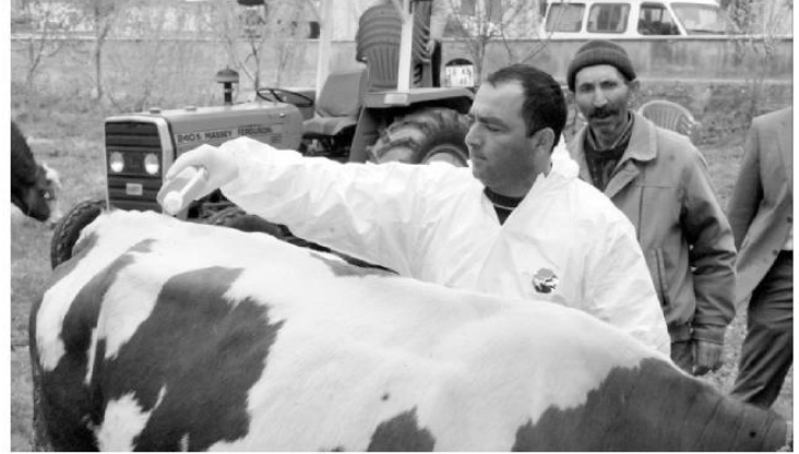
Gıda Tarım ve Hayvancılık İl Müdürlüğü ekipleri çalışmalarını sürdürüyor.

Gıda Tarım ve Hayvancılık İl Müdürü Erkan Elfaz Ermiş, Kırım Kongo Kanamalı Ateşi hastalığına neden olan zehirli kenelere karşı ilaçlama çalışmalarının yapıldığını açıklayarak, "Yıllar itibarıyla yapılan ilaç mücadele yanında çiftçilerimizin ve vatandaşların konu hakkında bilgi sahibi olması ve tedbirli davranmaları için yoğun eğitim programları başlatılmış özellikle Halk Sağlığı müdürlüğüyle birlikte ortak programlar düzenlenmiştir. Çiftçilere köylerde ve üretim alanlarında eğitim verildiği gibi şehir yaşamında bulunan vatandaşlara da sempozyum ve panellerle bilgi aktarımı yapılmış, riskli dönem içerisinde farkındalık oluşturmak için Kırım Kongo Kanamalı ateşli hastalığı hep gündemde tutulmaya çalışılmıştır. Ayrıca liflet broşür ve afiş gibi görsel materyallerle birlikte basınla işbirliği yapılarak gerek görsel gerek yazılı olarak zaman zaman bu hastalıkla ilgili bilgiler vatandaşlarla paylaşılmıştır. Bu çalışmaların çoğu koordinasyonla yapılmış, Halk Sağlığı Müdürlüğü, Damızlık Sığır Yetiştiricileri Birliği ve Koyun Keçi Yetiştiricileri Birliği ile ortaklaşa hareket edilmiştir.