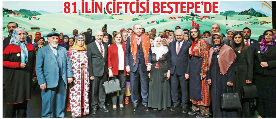
Konusma yapmak için kursu yürüten Cumhurbaşkanı Erdoğan'a officiler tarafından 'zeytin dalı' hediye edildi. Erdoğan, kursuyle elinde zeytin dalıyla çıkarken, toplantı sonrasında Başbakan Binali Yıldırım, Gıda, Tarım ve Hayvancılık Bakanı Ahmet Esref Fakıbaba ve illeri temsil eden sahneye davet edilen 81 çiftçiyile de aile fotoğrafı çektiler.