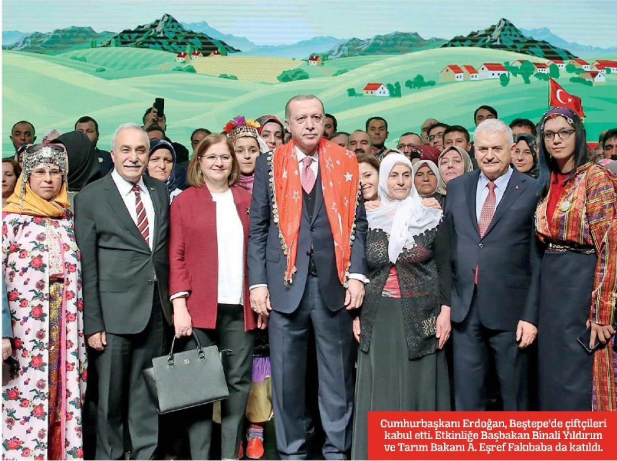
Cumhurbaşkanı Erdoğan, Beştepe'de çiftçileri kabul etti. Etkinliğe Başbakan Binali Yıldırım ve Tarım Bakanı A. Eşref Fakıbaba da katıldı.