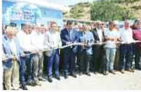
'Canlı Hayvan Pazarı'nın açılış kurdelesini, törenle kesildi.