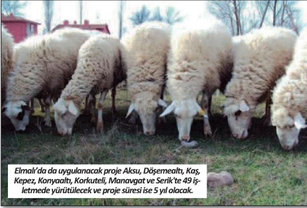
Elmalı'da da uygulanacak proje Aksu, Döşemealtı, Kaş, Kepez, Konyaaltı, Korkuteli, Manavgat ve Serik'te 49 işletmede yürütülecek ve proje süresi ise 5 yıl olacak.

Pırlak koyun ırkının ıslah çalışması Elmalı'da hayata geçirilecek