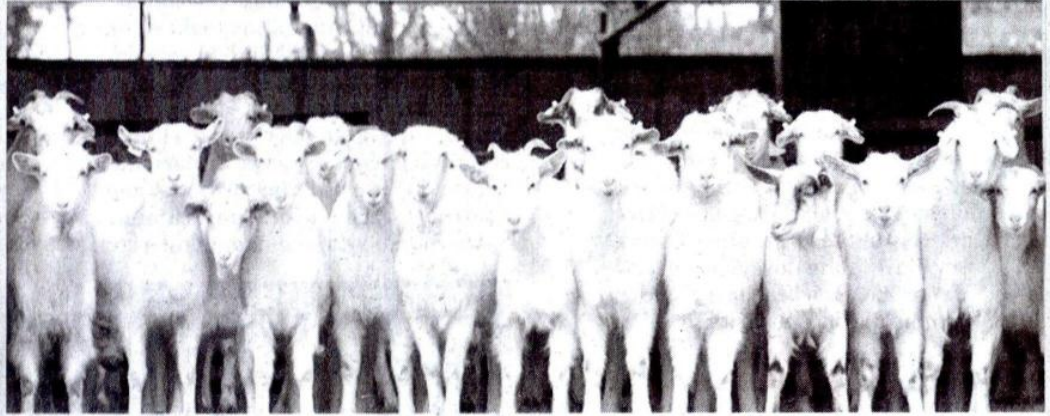
Uluslararası Keçicilik Kongresi, 25-30 Eylül tarihleri arasında Antalya'da Kervansaray Otelde gerçekleşecek.