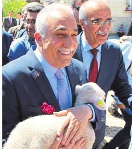
'Genç Çiftçi Projelerinin Desteklenmesi Programı'na katılan Gıda, Tarım ve Hayvancılık Bakanı Fakıbaba, burada bakanlık desteğiyle 300 küçükbaş hayvan alan ve bakımını yapan çiftçilerle bir araya geldi.

Çeşitli temaslarda bulunmak üzere Gaziantep'e gelen Gıda, Tarım ve Hayvancılık Bakanı Ahmet Eşref Fakıbaba, Türkiye'nin et ithal eden değil, ihraç eden bir ülke konumuna geleceğini söyledi.