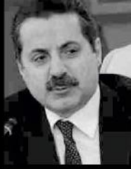
Gıda, Tarım ve Hayvancılık Bakanı Faruk Çelik

Mersin Valiliği'nden yapılan açıklama göre, bu sabah saat 10.00'da önce Vali Özdemir Çakacak'ı ziyaret edecek olan Başbakan Yardımcısı Lütfi Elvan ve Gıda, Tarım ve Hayvancılık Bakanı Faruk Çelik, daha sonra Yenişehir Kültür Merkezi'nde damızlık Koyun ve Keçi Üreticileri Birliği'nce düzenlenen Çoban Eğitim kursunu başarıyla tamamlayan kursiyerler için düzenlenecek sertifika törenine katılacak. Ardından Mersin tarım müdürlüğü tarafından desteklenen projeler için Akdeniz ihracatçı Birlikleri'nde düzenlenecek temsili çek verme törenine iştirak edecekler.