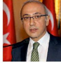
Bakan Lütfi Elvan