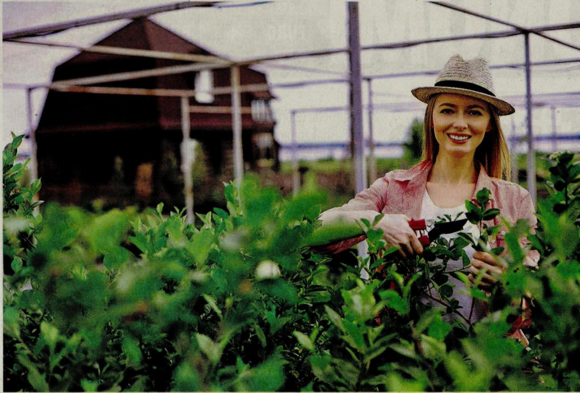
Proje kapsamında verilecek hibe desteklerine yönelik başvuru mercileri Gıda Tarım ve Hayvancılık Bakanlığı il ve ilçe müdürlükleri olup, müracaatçılardan başvuru için herhangi bir ücret talep edilmemektedir.