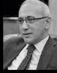
Başbakan Yardımcısı Lütfi Elvan

Mersin Valiliği'nden yapılan açıklama göre, bu sabah saat 10.00'da önce Vali Özdemir Çakacak'ı ziyaret edecek olan Başbakan Yardımcısı Lütfi Elvan ve Gıda, Tarım ve Hayvancılık Bakanı Faruk Çelik, daha sonra Yenişehir Kültür Merkezi'nde damızlık Koyun ve Keçi Üreticileri Birliği'nce düzenlenen Çoban Eğitim kursunu başarıyla tamamlayan kursiyerler için düzenlenecek sertifika törenine katılacak. Ardından Mersin tarım müdürlüğü tarafından desteklenen projeler için Akdeniz ihracatçı Birlikleri'nde düzenlenecek temsili çek verme törenine iştirak edecekler.