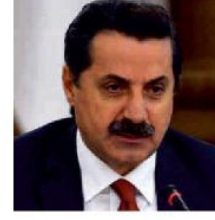
Bakanı Faruk Çelik

Başbakan Yardımcısı Lütfi Elvan ve Gıda, Tarım ve Hayvancılık Bakanı Faruk Çelik bugün Mersin'de olacak. 4'te