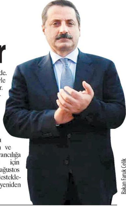
Bakan Faruk Çelik

zaten gündemimizde. Anaç koyun, keçiyle ilgili desteğimiz var. Bunu biraz artıracğız. Hiç olmazsa bu desteğin hayvan başı 20 lira ise 25 lira yapalım. Elimizde bir bütçe var o bütçe imkanları çerçevesinde koyun ve keçi küçükbaş hayvancılığa verdiğimiz önem için söylüyorum. Yoksa ağustos ayında oturup, bu desteklemeleri 2017 için yeniden paylaşacağız."