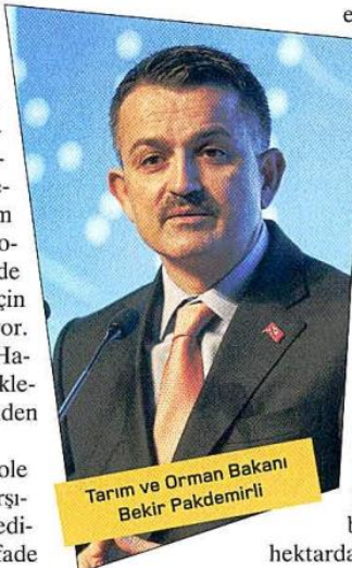
Tarım ve Orman Bakanı Bekir Pakdemirli

"Evde kal" çağrılarıyla vatandaşın kendisini izole ettiği salgın günlerinde, üretici gıda ihtiyacını karşılamak için büyük bir özveriyle üretmeye devam ediyor. Türkiye'nin gıda stokunun yeterli olduğunu ifade