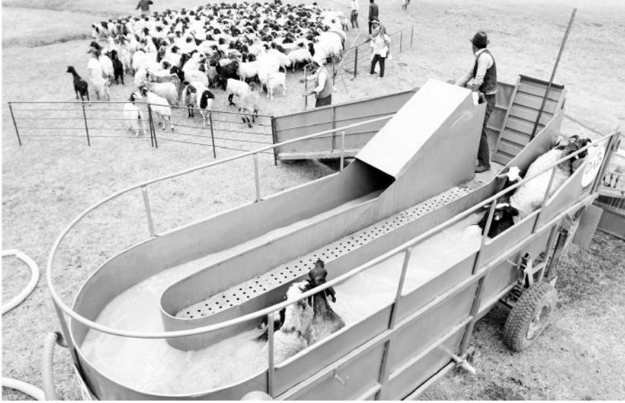
Van'da koyunlar, özel hazırlanan "mobil koyun banyosu" ile köylerde dezenfekte ediliyor.