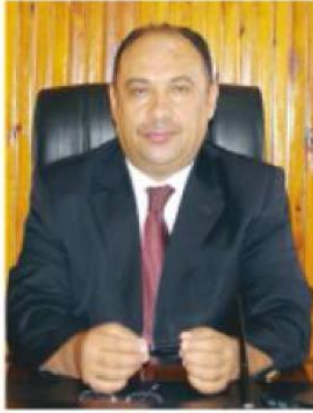
"Ülkemiz koyunculunun son 15 yılda