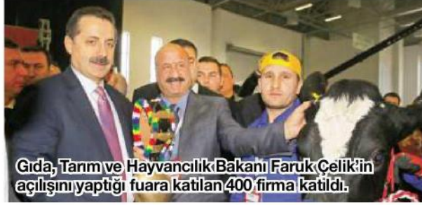
Gıda, Tarım ve Hayvancılık Bakanı Faruk Çelik'in açılışını yaptığı fuara katılan 400 firma katıldı.

230 bin kişinin ziyaret etmesi hedeflenen 11. Uluslararası İzmir Tarım ve Hayvancılık Fuarı'nı 250 bin kişi gezdi