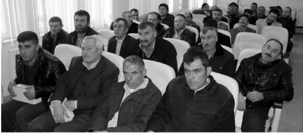
Çorum Damızlık Koyun ve Keçi Yetiştiricileri Birliği Kıl Keçisi ıslah çalışmaları ile ilgili toplantı düzenledi.