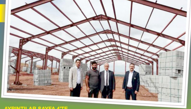
AYRINTILAR SAYFA 4'TE

500 baş kapasiteye sahip olacak üretim istasyonu ile Tokat'ın kaliteli damızlık koç ve teke ihtiyacı karşılanacak. Tesis faaliyete geçtiğinde burada damızlık olarak yetiştirilen ve yetiştiricilere satılacak koç ve tekelerin bedelinin yüzde 50'si bakanlık tarafından hibe olarak karşılanacak. Bedeli 560.000 TL olan projenin yüzde 50'si bakanlık tarafından hibe olarak karşılanacak.