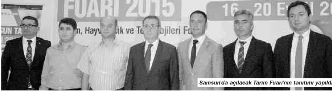
Samsun'da açılacak Tarım Fuarı'nın tanıtımı yapıldı

Samsun Tarım Fuarı, 16-20 Eylül tarihleri arasında TÜYAP Samsun Fuar ve Kongre Merkezi'nde kapılarını ziyaretçilerine açacak. TÜYAP Anadolu Fuarları Genel Müdürü Ersözlü "Fuara 50 bin ziyaretçi bekliyoruz" dedi