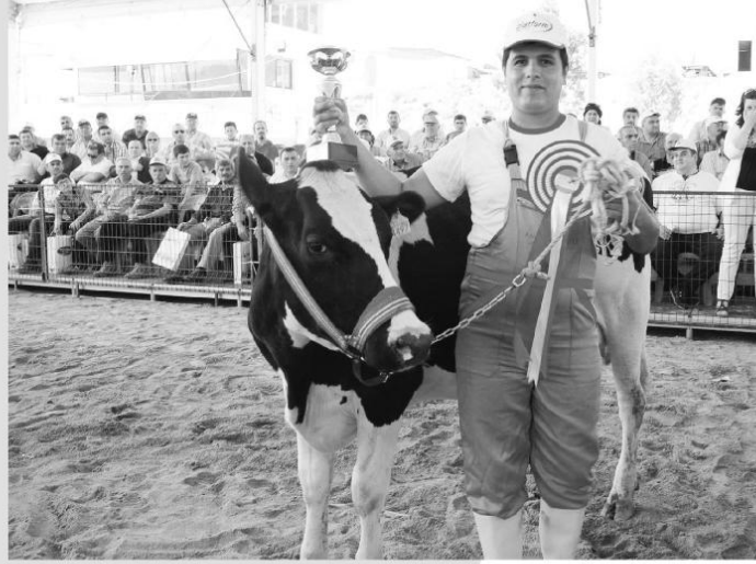
Kasım ayında gerçekleşecek fuar için 80 bin ziyaretçi bekleniyor.

A yдын'ın Kuşadası ilçesi'nde düzenlenecek Türkiye'nin ilk ve tek canlı hayvan fuarı olma özelliğini taşıyan Anadolu EXPO 2. Canlı Hayvan Fuarı, sektörün devlerini ağırlayacak.