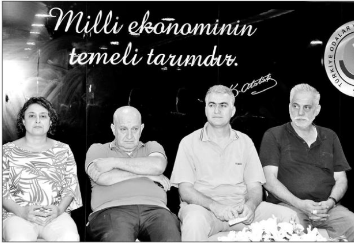
Antalya Ticaret Borsası Canlı Hayvan Et Ticareti Meslek Komitesi, yaklaşan Kurban Bayramı öncesinde sektör temsilcilerini bir araya getirdi. Antalya'da geçen yıl Kurban Bayramı'nda 11 bin büyükbaş, 155 bin civarı da küçükbaş hayvan kurban edildi.

Türkiye'nin 5. büyük ili Antalya'da kurbanlık hayvan sayısında sıkıntı olmamasına rağmen büyükbaş fiyatları geçen seneye göre yüzde 30 arttı