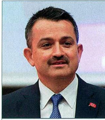
Tarım ve Orman Bakanı Bekir Pakdemirli

Türkiye’de tarımsal ürünlerin ekolojik ve ekonomik olarak uygun alanlarda verimli ve kaliteli olarak üretilmesi, tarımsal hasılanın artırılması, arz talep dengesinin sağlanması, toprak ve su kaynaklarının korunarak sürdürülebilirliği, ihtiyaç duyulan