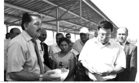
Damızlık, Koyun ve Keçi Yetiştiricileri Birliği, Valilik ve İl Gıda Tarım ve Hayvancılık Müdürlüğü tarafından 97 üreticiye Akkaraman damızlık koçu teslim edildi.