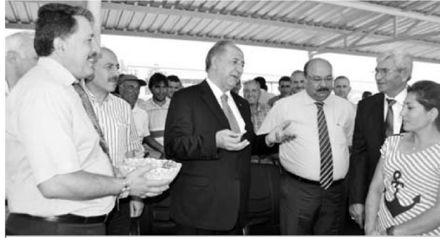
Düzenlenen törene katılan Protokol üyeleri başvuru yapan vatandaşlar adına kura çekti.