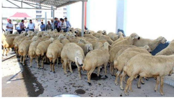
Damızlık koçların dağıtımı için dün Gıda Tarım ve Hayvancılık İl Müdürlüğü bahçesinde bir tören düzenlendi.