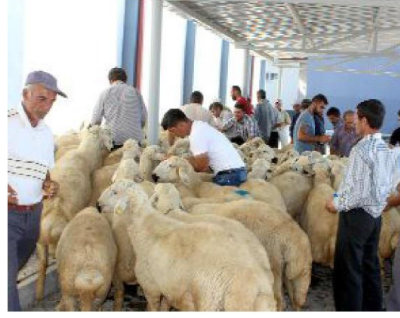
Üreticiler kur'ada kendilerine çıkan koçları küpe numaralarından bakarak buldular.