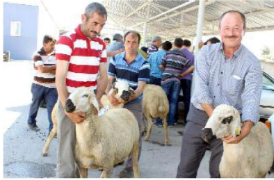
Damızlık koçlarına kavuşan üreticilerin, son derece memnun oldukları gözlemlendi.

Çorum'da küçükbaş hayvan kalitesinin artırılması ve mevcut koyun ve keçi ırklarının ıslahı çalışmaları kapsamında damızlık vasfı yüksek 97 adet "Akkaraman" cinsi damızlık koç, çekilen kur'a sonucu sahiplerine ulaştırıldı.