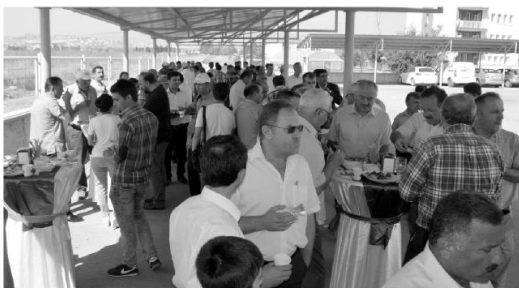
Dağıtım töreni sonrası kokteyl düzenlendi.