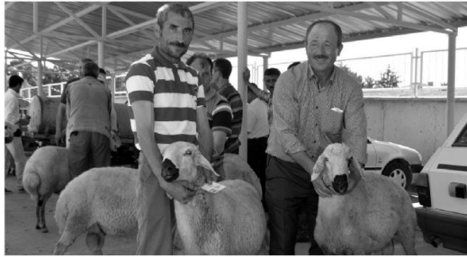
Kura ile 100 Akkaraman cinsi damızlık koç dağıtımı yapıldı.