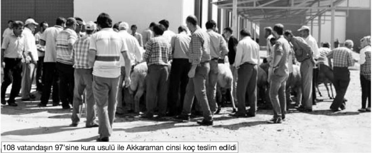
108 vatandaşın 97'sine kura usulü ile Akkaraman cinsi koç teslim edildi