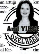
AYŞE YILMAZ ÖZEL HABER

Kırmızı etin sürekli fiyatının arttığı son günlerde sağlık ve lezzetiyle geleneksel Türk mutfağında yeri olan oğlak ve keçi etine talep artmaya başladı. 2014 yılında küçükbaş hayvan ürünlerinin bir önceki yıla göre yüzde 230 oranında artış gösterdiğini kaydeden İzmir Damızlık Koyun-Keçi Yetiştiricileri Birliği Başkanı ve Ulusal Kırmızı