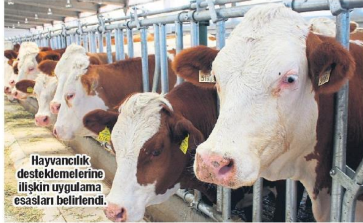
Hayvancılık desteklemelerine ilişkin uygulama esasları belirlendi.