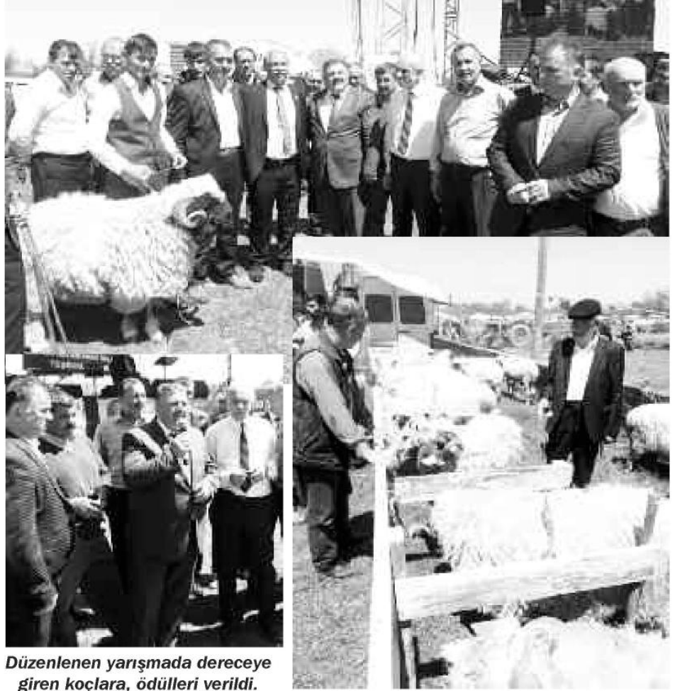
Düzenlenen yarışmada dereceye giren koçlara, ödülleri verildi.