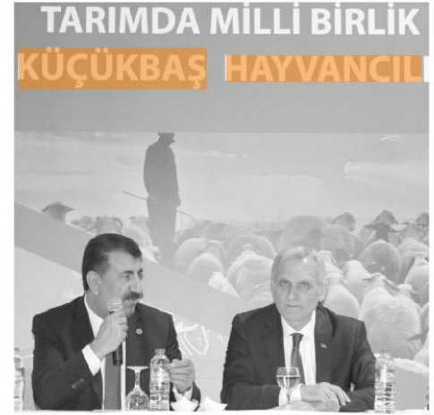
Küçükbaş Hayvancılık Şurası yapıldı

■ YAYLA yasaklarının hala uygulanıyor olmasından duyduğu üzüntüyü dile getiren Çelik, ivedilikle bu yasakların kaldırılması gerektiğini ve bu konunun takipçisi olduklarını kaydetti. Hayvan sevkleri yapılırken işletmeden ayrılan hayvanların kulak