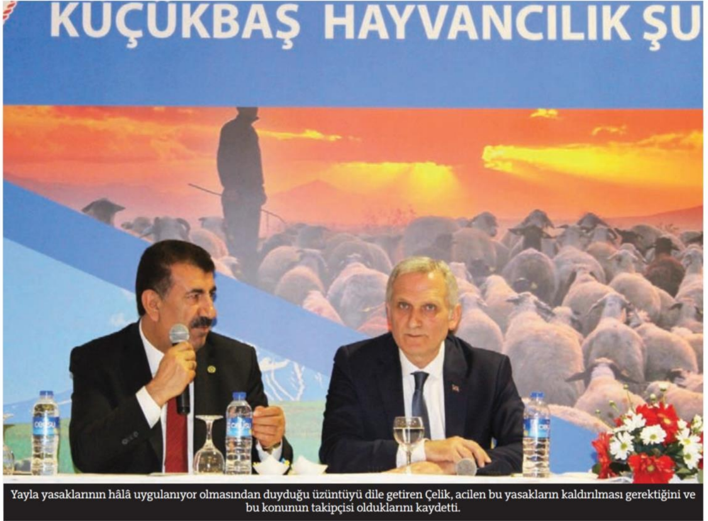
Yayla yasaklarının hâlâ uygulanıyor olmasından duyduğu üzüntüyü dile getiren Çelik, acilen bu yasakların kaldırılması gerektiğini ve bu konunun takipçisi olduklarını kaydetti.