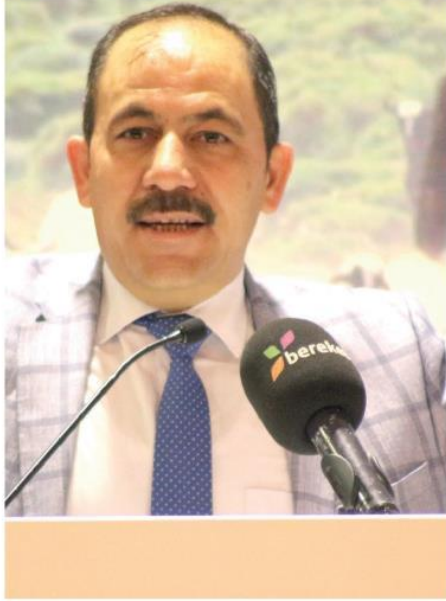
Tarımda Milli Birlik Projesi kap-