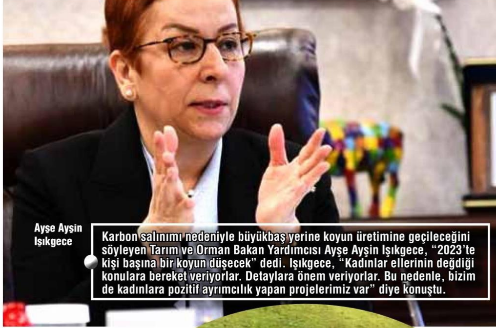
Ayşe Aysin Işıkgece

Karbon salınımı nedeniyle büyükbaş yerine koyun üretimine geçileceğini söyleyen Tarım ve Orman Bakan Yardımcısı Ayşe Aysin Işıkgece, "2023'te kişi başına bir koyun düşecek" dedi. Işıkgece, "Kadınlar ellerinin değdiği konulara bereket veriyorlar. Detaylara önem veriyorlar. Bu nedenle, bizim de kadınlara pozitif ayrımcılık yapan projelerimiz var" diye konuştu.