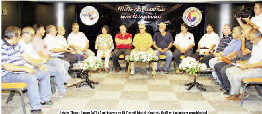
Antalya Ticaret Borsası (ATB) Canlı Hayvan ve Et Ticareti Meslek Komitesi, Eylül ayı toplantısını gerçekleştirdi

Toplantıya katılan Gıda Tarım ve Hayvancılık İl Müdürlüğü, Antalya Büyükşehir Belediyesi, Döğemealın Belediyesinden temsilciler hayvan sağlığı ve kurban kesim yerleriyle ilgili aldıkları önlemleri anlattı.