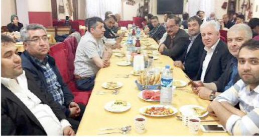
Kasaplar ve Celepler Odası'nın iftar yemeğine protokol üyelerinin yanı sıra oda başkanları ve çok sayıda meslek mensubu katıldı.