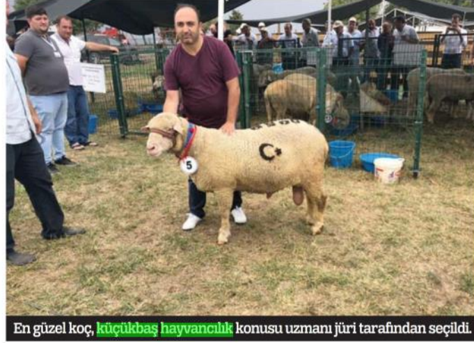
En güzel koç, küçükbaş hayvancılık konusu uzmanı jüri tarafından seçildi.