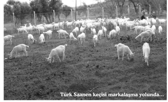
Türk Saanen keçisi markalaşma yolunda...