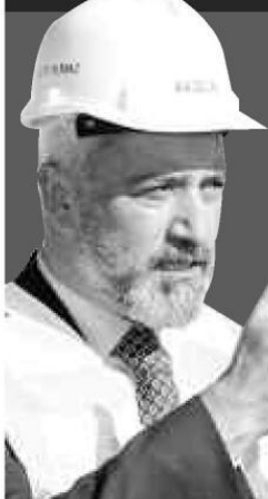
Ordu Büyükşehir Belediye Başkanı Enver Yılmaz