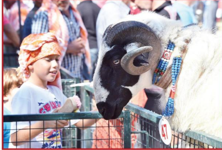
Çocuklar, yarışmacı hayvanlarına bakım yapıyor.