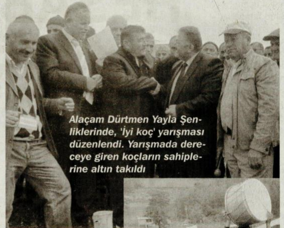
Alaçam Dürtmen Yayla Şenliklerinde, 'İyi koç' yarışması düzenlendi. Yarışmada dereceye giren koçların sahiplerine altın takıldı