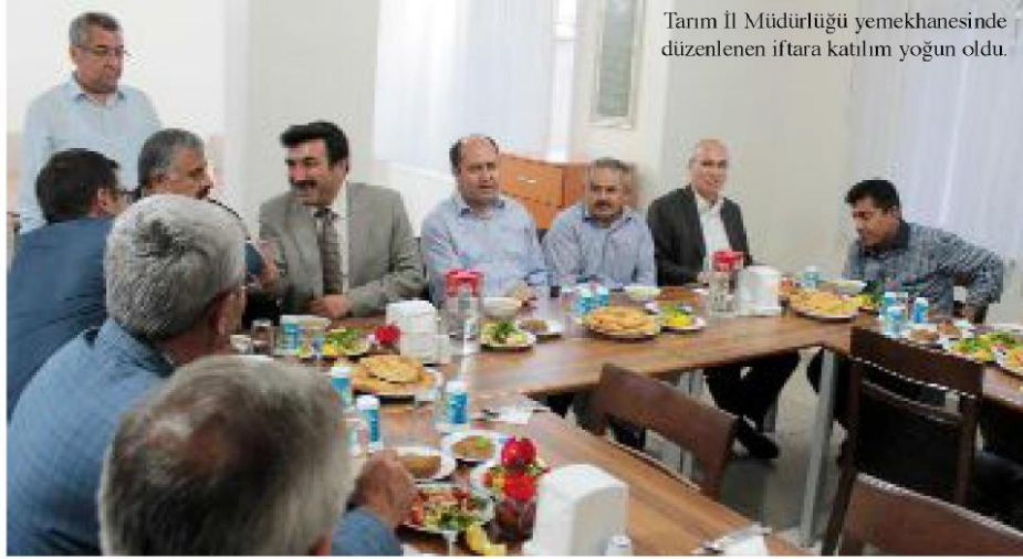
Tarım İl Müdürlüğü yemekhanesinde düzenlenen iftara katılım yoğun oldu.