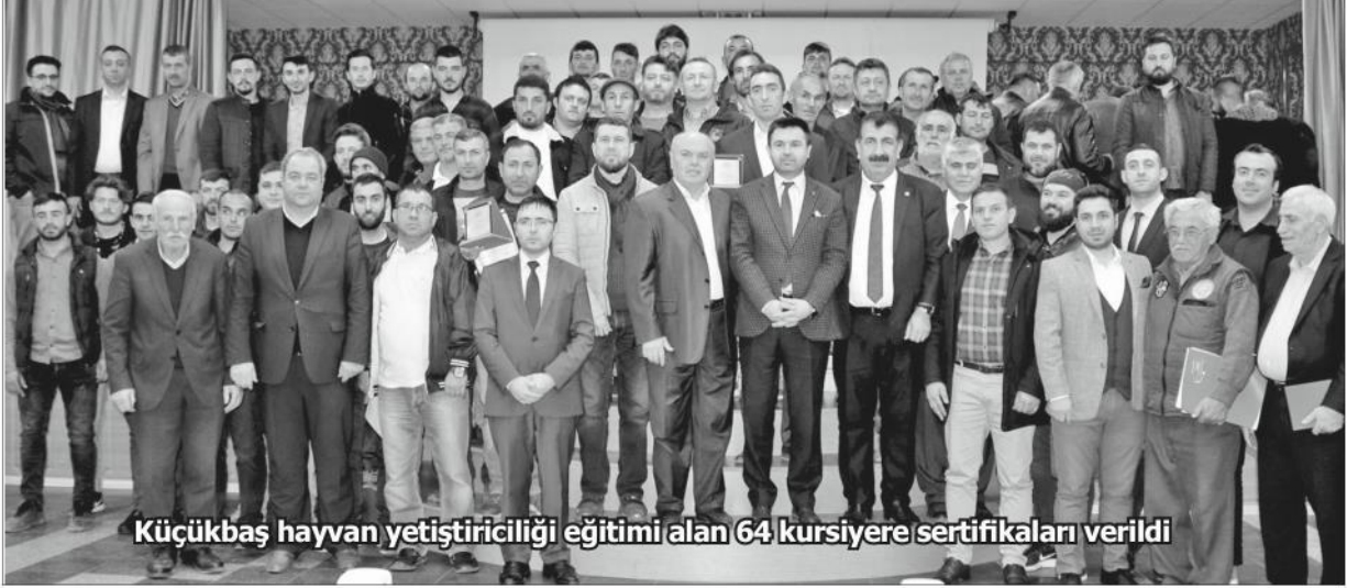
Küçükbaş hayvan yetiştiriciliği eğitimi alan 64 kursiyere sertifikaları verildi