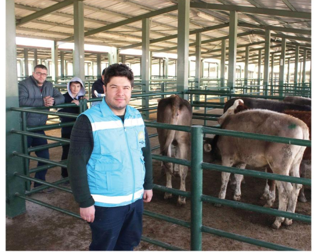
Eskişehir'de 143 genç çiftçi, devletten hibe desteğini alarak köyüne döndü. Bu çiftçilerin 108'ini kadınlar oluşturdular.