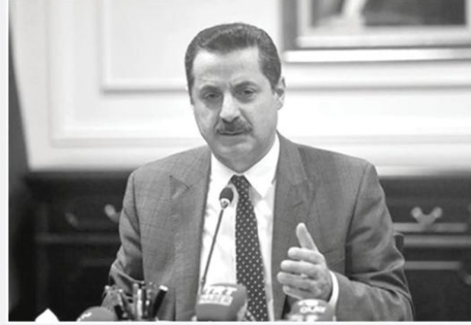
Gıda, Tarım ve Hayvancılık Bakanı Faruk Çelik

Bitkisel ürünlerle ilgili bu sene dolu ana riski, fırtına, hortum, yangın, heyelan, deprem, sel ve su baskını ek risklerinin yanı sıra, isteğe bağlı olmak üzere açık alanda yetiştirilen meyvelerin don riskinin de teminat kapsamında olduğunu hatırlatan Çelik, gelecek sene olgunlaşma ve hasat döneminde meydana gelen yağışlar nedeniyle kiraz ürünü; dolu, yangın, fırtına, hortum, heyelan, deprem, sel ve kar ağırlığı nedeniyle meyve ağaçları ve asmaların kendisinin ilk kez teminat altına alınacağına dikkati çekti.