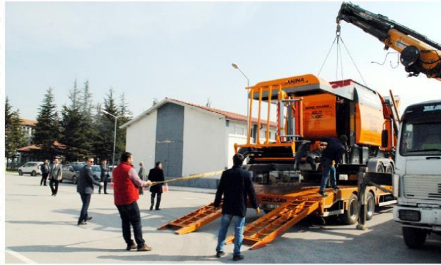
Silaj makinesi kaba yemde girdi maliyetlerini düşürüyor.

mısır ve yonca silajları yaparak, küçükbaş hayvancılığı güçlendireceklerini dile getirdi.