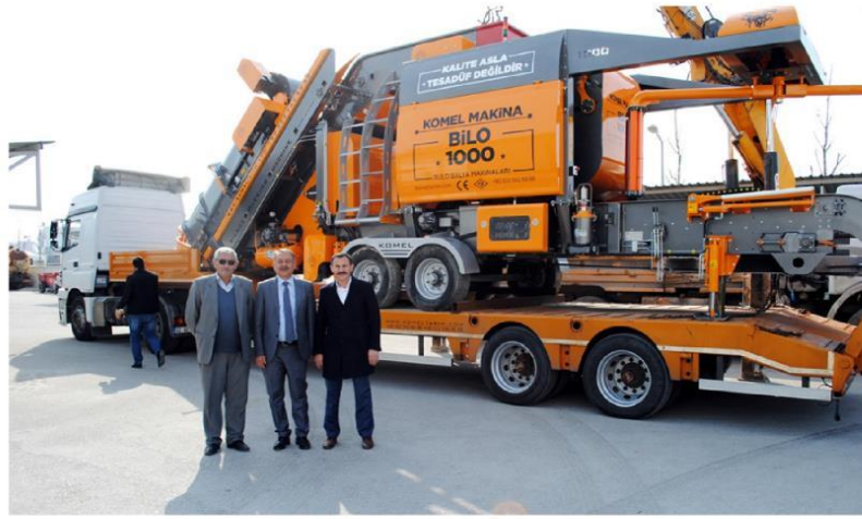
Makine Çorum Gıda, Tarım ve Hayvancılık İl Müdürlüğü tarafından alındı.