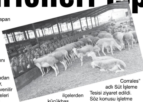
Corrales” adlı Süt İşleme Tesisini ziyaret edildi. Söz konusu işletme butik bir işletme olması açısından yetiştiricilerimize örnek teşkil etmiştir.

Gıda Tarım ve Hayvancılık İl Müdürlüğü, ÇOMÜ, Çanakkale Damızlık Koyun Keçi Yetiştiricileri Birliği ve küçükbaş hayvan yetiştiricileri ile işbirliği yapılarak “Küçükbaş hayvanlarda meme dezenfeksiyonu” ve “Sağım kaplarında dezenfeksiyonun önemi” konularında 4 adet metod demonstrasyonu gerçekleştirilen projenin yurt dışı inceleme gezisi İspanya'ya yapıldı. İspanya'nın Valencia ve Murcia kentlerine yapılan ve 5 gün süren Çiftçi İnceleme Gezisine farklı