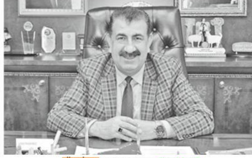
TÜDKİYEB Genel Başkanı Nihat Çelik