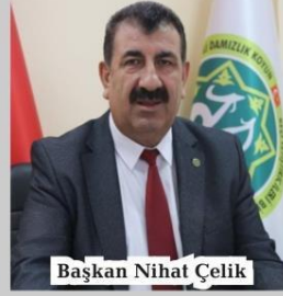
Başkan Nihat Çelik

hayvan yetiştiricileri için de müjdeli haber belediklerine işaret ederek, şunları kaydetti: " Küçükbaş hayvancılık sektöründe faaliyet gösteren yetiştiricilerimiz, çoğunlukla bitkisel üretimi de beraberinde yapan aile işletmesi oldukları için erken ödeme müjdesi sektörümüzü de memnun etmiştir. Ancak sektörümüz için verilen en önemli ve doğrudan yetiştiricilerimizin hesabına yatırılan destek, anaç koyun-keçi desteklemeleridir ve ödemeleri ise genellikle her yıl mayıs ayı sonunda veya haziran ayı içerisinde yapılmaktadır. Anaç koyun-keçi destekleme ödemelerinin 2024 yılının mart ayında yapılması, en büyük temenni ve beklentilerimizden birisidir. Sayın Cumhurbaşkanımızdan, 280 bin yetiştiricimizi mutlu etmek adına bu ödemelerin, yetiştiricilerimizin sıcak paraya en çok ihtiyaç duyduğu mart ya da en geç nisan ayında ödenmesine dair bir müjde vermesini bekliyoruz." ■» (AA)