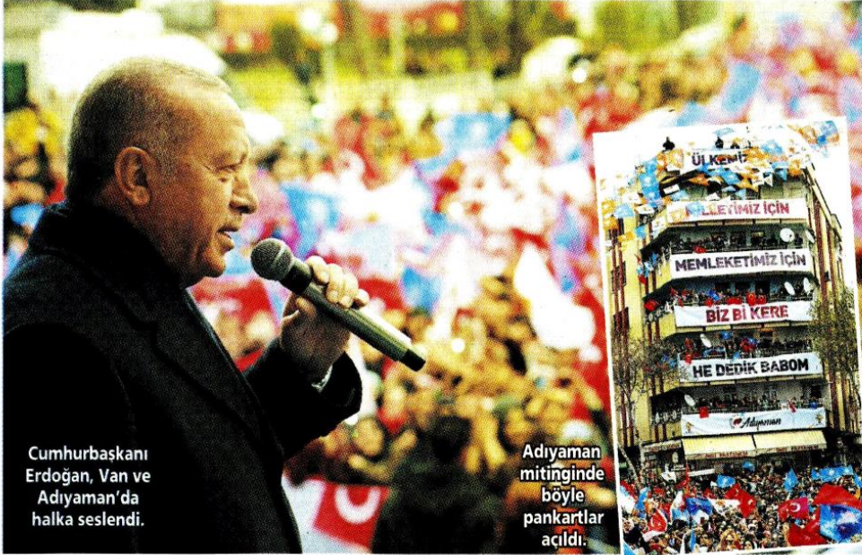
Cumhurbaşkanı Erdoğan, Van ve Adıyaman'da halka seslendi.