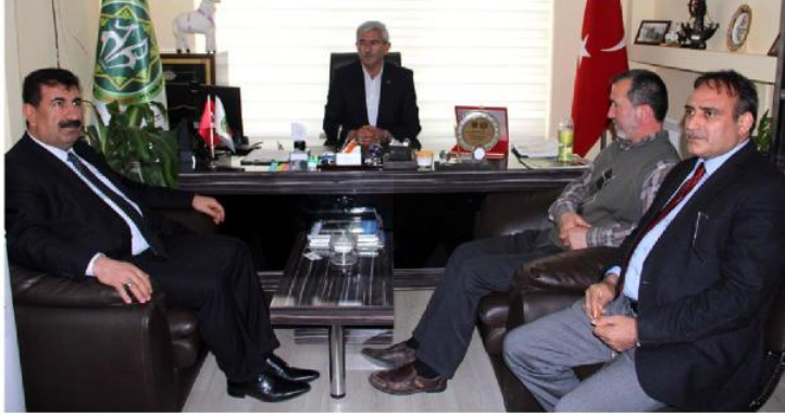
Ziyarette 24 Nisan'da yapılacak olan Birlik seçimi hakkında değerlendirme yapıldı.