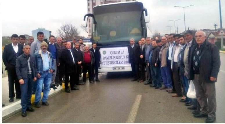
Fuarı Çorum'dan çok sayıda üretici ziyaret etti.

Fuar gibi bu tür etkinliklerde aynı zamanda diğer illerdeki yetiştiricilerle bilgi alışverişinde bulunma fırsatı da tanıdığını kaydeden Av-