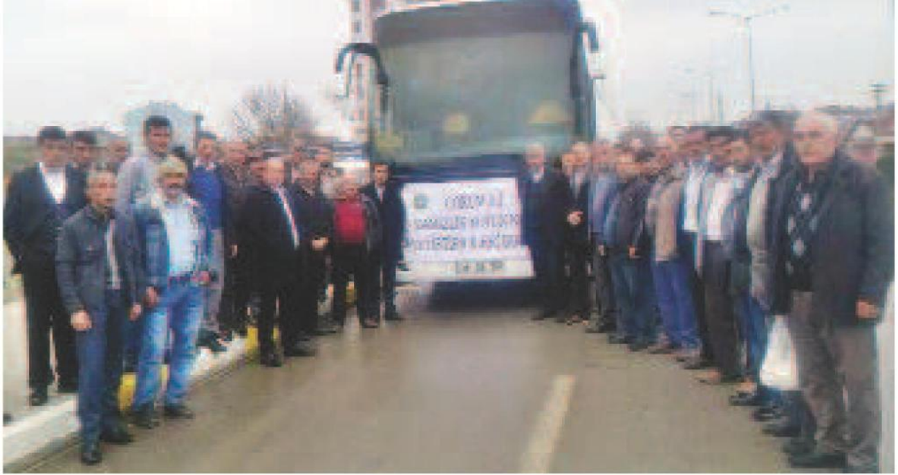
Çorum Damızlık Koyun ve Keçi Yetiştiricileri Birliği üyeleri, Konya'da düzenlenen 14. Uluslararası Tarım, Tarımsal Mekanizasyon ve Tarla Teknolojileri Fuarı'na katıldı.