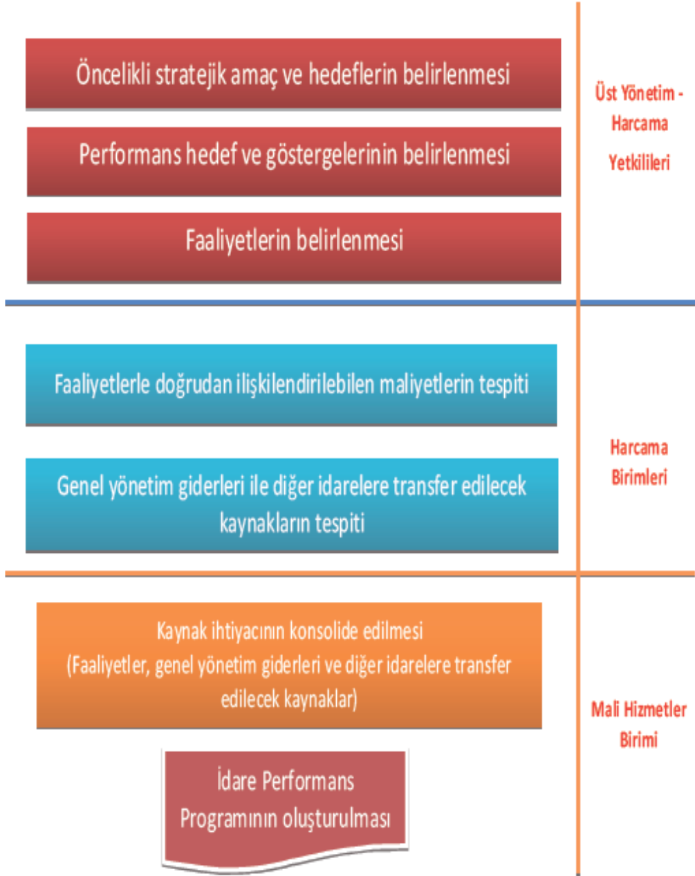
Şekil 2- Performans Programı Hazırlama Süreci